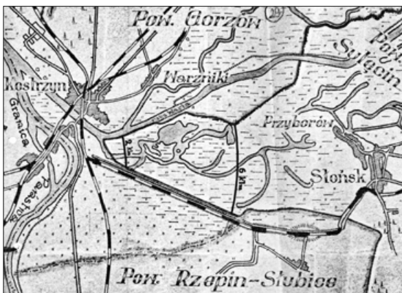
Ryc. 1. Projekt strefy nadgranicznej z 1947 r. w powiecie sulęcińskim o szerokości 2 i 6 km.

Dość nieoczekiwanie MZO uznało, że dotychczasowe oznaczenie strefy przygranicznej nie było należyście przeprowadzone. Dlatego też okólnikiem nr 61/47 z 1 września 1947 r. nakazało powołanie specjalnych komisji do spraw granicznych celem ustalenia, topograficznego opisanie i oznaczenia w terenie pasa drogi granicznej, strefy nadgranicznej, pasa celnego oraz opracowania wniosków co do ustalenia pasa granicznego 33 . Okólnikiem ponowiono zarządzenie wydane rok wcześniej, z tym że jego wykonanie zlecono dopiero co powołanym komisjom granicznym, których skład został określony w tymże dokumencie. Na czele komisji stanąć miał przedstawiciel wojewódzkiej władzy administracji