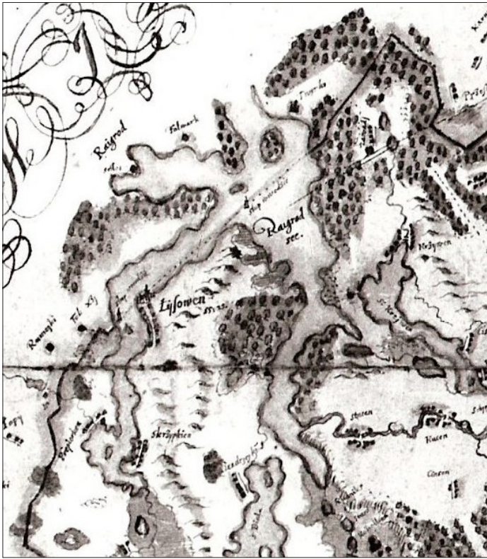
Ryc. 2. Dokonane w 1422 r. rozgraniczenie Jeziora Rajgrodzkiego między Litwę i państwo zakonne na mapie starostwa etckiego Józefa Narońskiego z ok. 1660 r.

chodziło o miejscowość, jak przyjął Henryk Rutkowski (s. 147, por. s. 152), czy o jezioro. Opowiadając się za miejscowością, Autor uznał, że w dokumencie „brak dodatkowego określenia, które występuje przy nazwach wód”. Jak rozumiem, chodzi tu o nazwy pospolite w rodzaju lacus lub flumen itp. Z mojego doświadczenia wynika jednak, że nie posługiwano się nimi w każdym przypadku opisywania granic 23 . Brak takiego określenia przed nazwą własną nie może zatem jednoznacznie wskazywać, że szło o miejscowość.