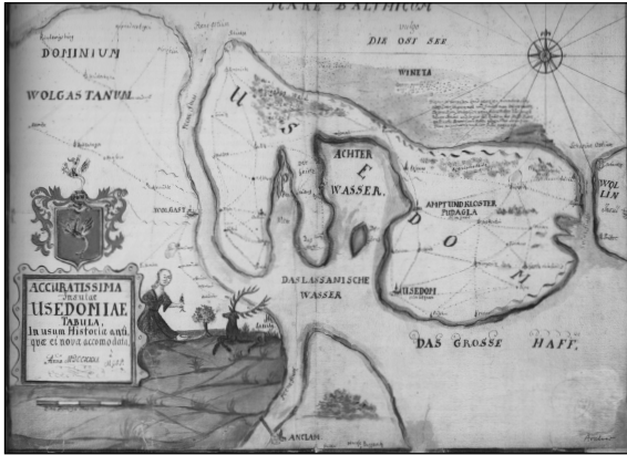
Ryc. 1. Rękopiśmienna mapa wyspy Uznam z 1732 r. (nr 58 w katalogu)

z 1728 r. słynącego z dzieł tego rodzaju Gerarda van Keulena. Zaskakuje natomiast następna, rękopiśmienna i intensywnie kolorowana mapa wyspy Uznam z 1732 r. Nie jest może dokładna, lecz na pewno widowiskowa i również morska.