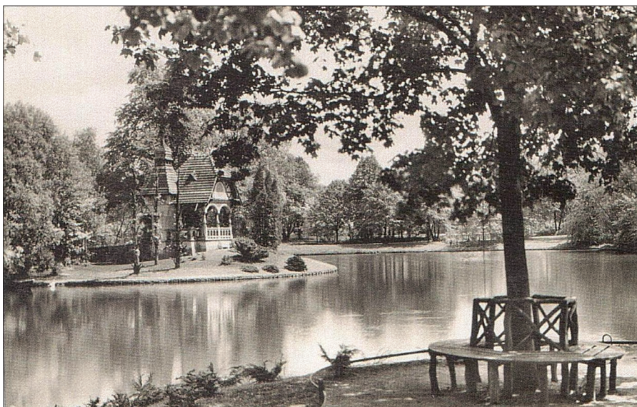
3. Park Południowy, pawilon Juliusa Schottländera. Poczтівka, ok. 1935, zbiory prywatne.