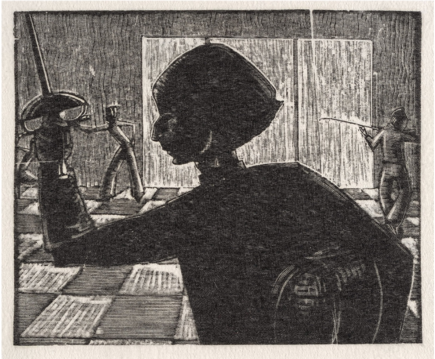
2. Wiktoria Goryńska, Autoportret jako florecistka , drzeworyt, bib., 92 x 111, ok. 1932–1935, Muzeum Narodowe w Warszawie, Gr.W.4735/1.