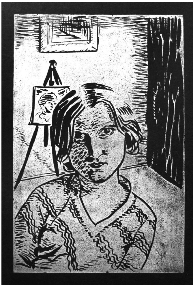
3. Janina Giedroyc-Wawrzynowicz, Autoportret ze sztalugami , drzeworyt, 203 x 127, ok. 1933, własność prywatna.