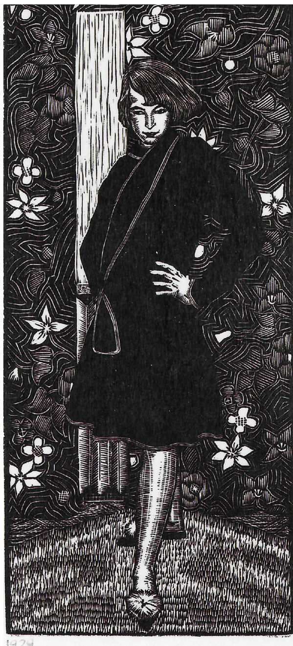
1. Wiktoria Goryńska, Autoportret w stroju domowym , drzeworyt, 237 x 142, 1929, Biblioteka Uniwersytetu Warszawskiego, Inw. GR 1303.