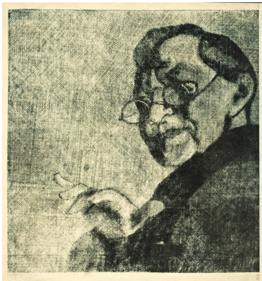
5. Wanda Komorowska, Autoportret II , mezzotinta, Muzeum Narodowe we Wrocławiu, VII-4572.