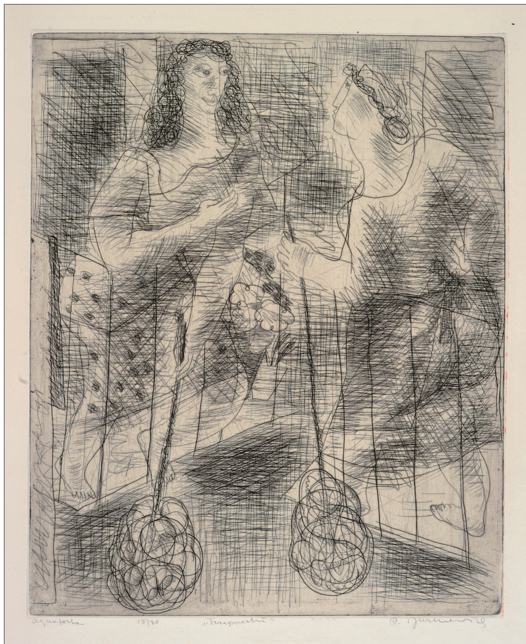
Il. 1. Andrzej Jurkiewicz, Trzepaczki , ok. 1934, akwaforta, własność Muzeum Okręgowego im. L. Wyczółkowskiego w Bydgoszczy, MOB GW/4797, fot. Wojciech Woźniak