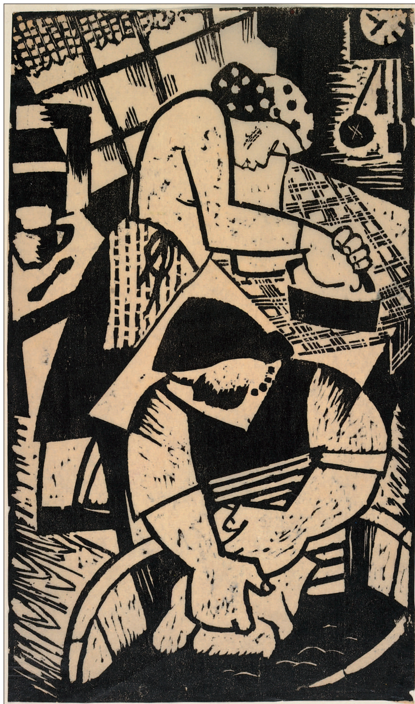
Il. 5. Eugeniusz Waniek, W pralni , 1934, drzeworyt, własność Muzeum Okręgowego im. L. Wyczółkowskiego w Bydgoszczy, MOB GW/2111