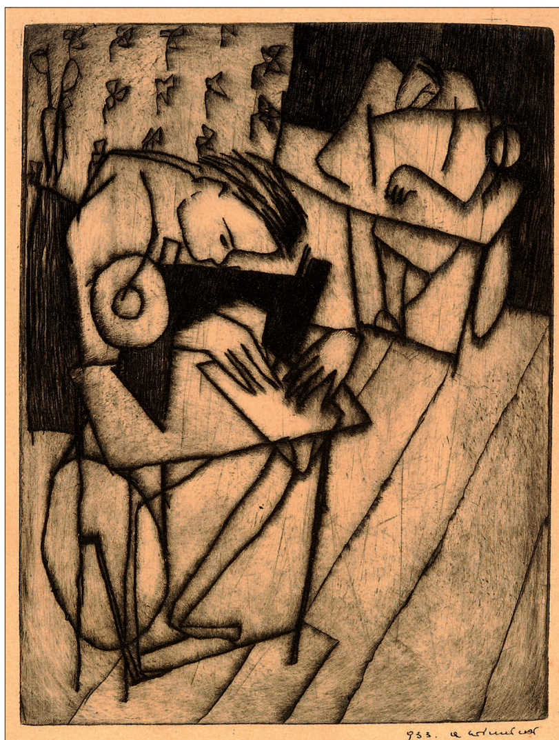
Il. 6. Aleksander Winnicki-Radziewicz, Szpaczka , 1933, sucha igła, własność Muzeum Okręgowe im. L. Wyczółkowskiego w Bydgoszczy, MOB GW/2887, fot. Wojciech Woźniak