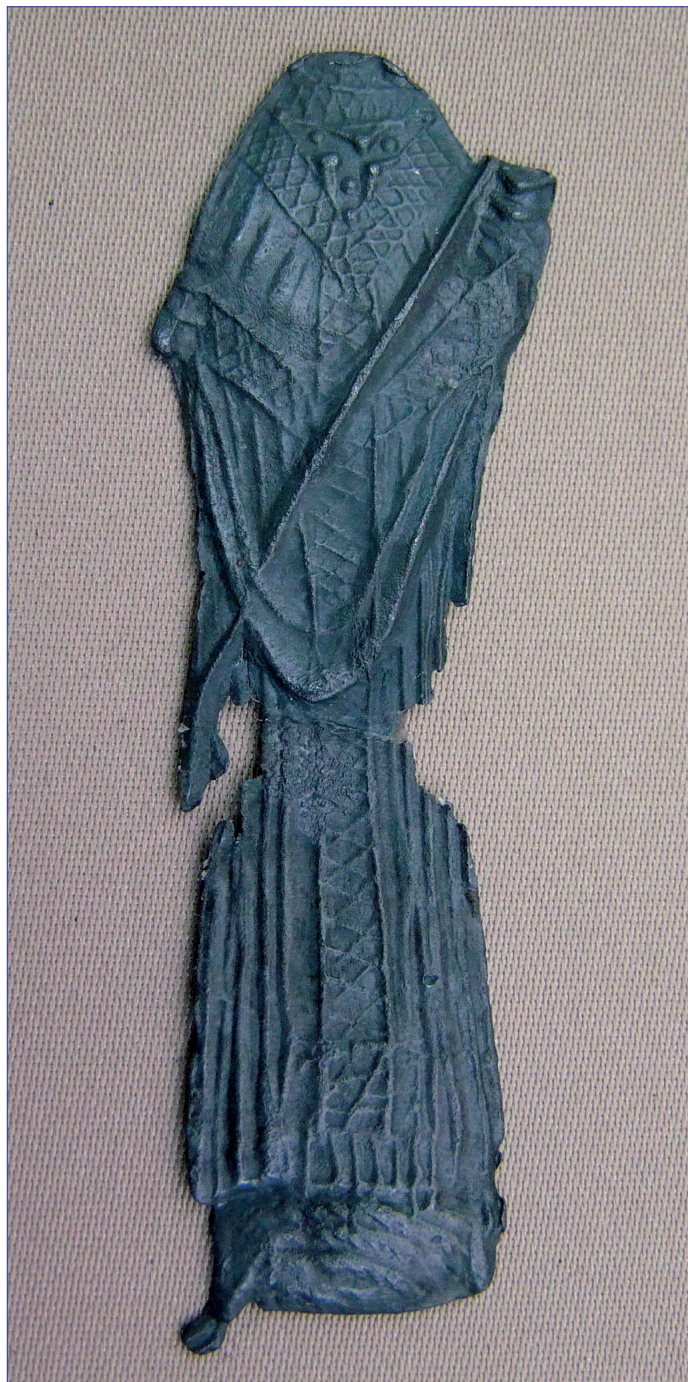
Fot. 10. Znak pielgrzymi IP 628. Stan po konserwacji