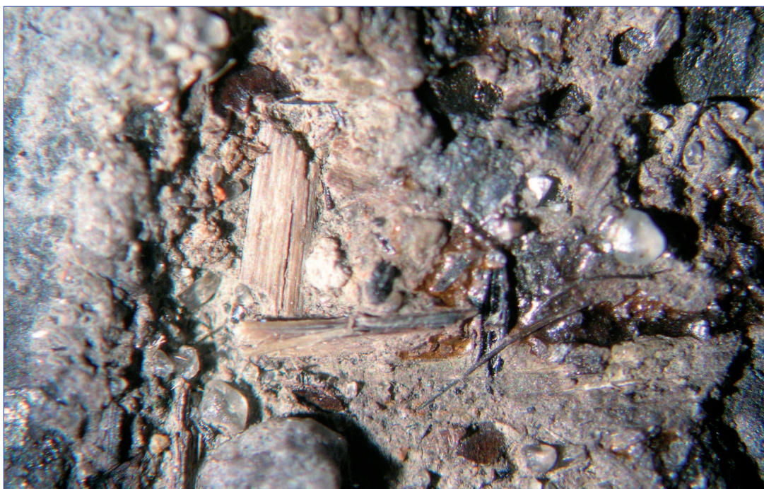
Fot. 7. Znak pielgrzymi IP 1001, rewers, depozyty organiczne i nieorganiczne: ziarna kwarcu, fragmenty drewna, mulek