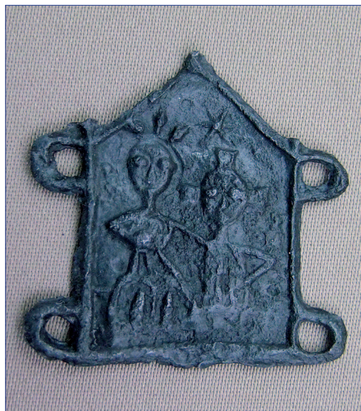
Fot. 11. Znak pielgrzymi IP 1001. Stan po konserwacji