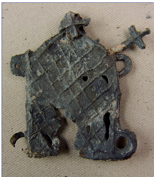
Fot. 2a, b. Znak pielgrzymi IP 293, awers i rewers, wymiary 36,5 × 31,1 mm. Stan przed konserwacją