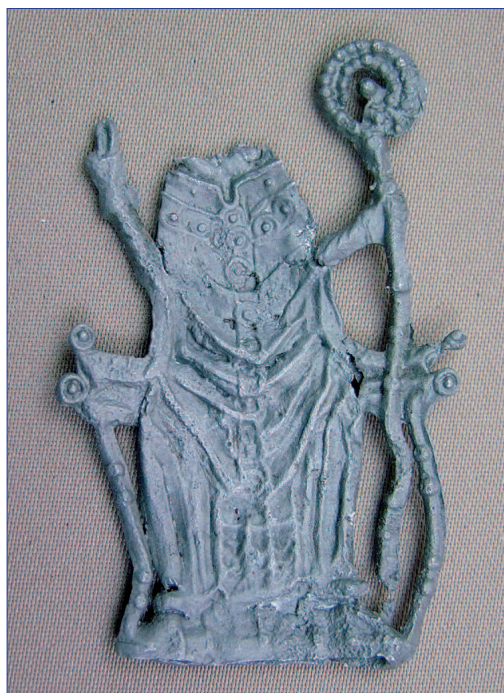
Fot. 8a, b. Znak pielgrzymi IP 129. Stan po konserwacji