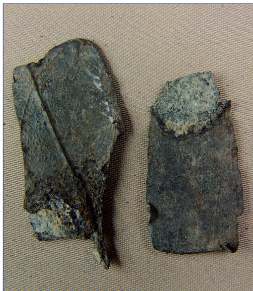
Fot. 3a, b. Znak pielgrzymi IP 628, awers i rewers, wymiary 40 × 18,5 mm; 30,4 × 1,52 mm. Stan przed konserwacją