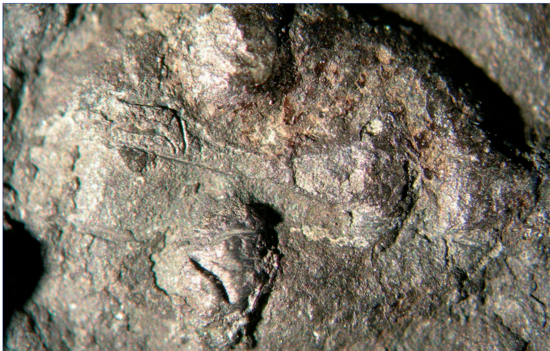
Fot. 6. Znak pielgrzymi IP 1001, awers, nawarstwienia korozyjne