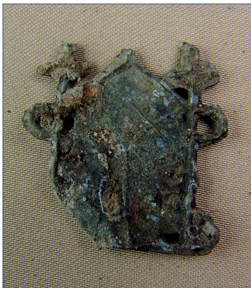
Fot. 5a, b. Znak pielgrzymi IP 1342, awers i rewers, wymiary 30,3 × 30,8 mm. Stan przed konserwacją