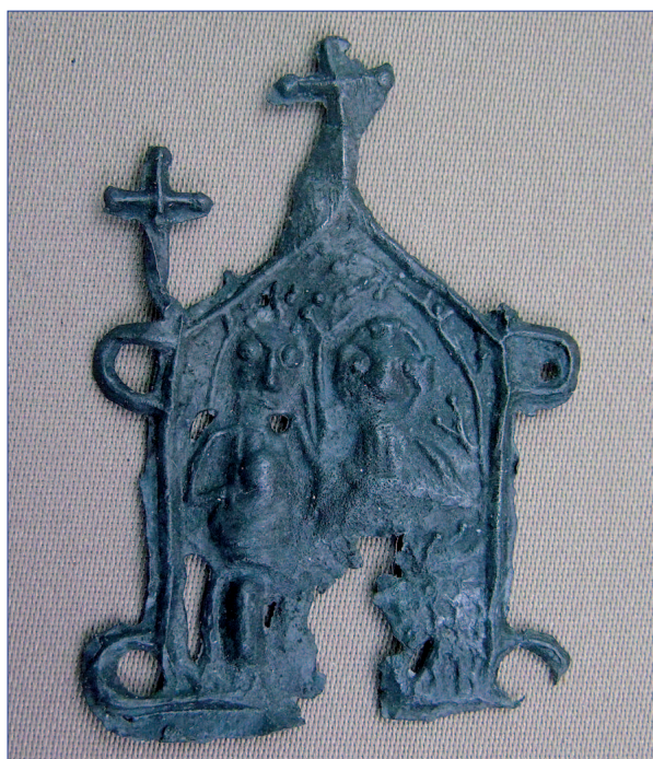
Fot. 9. Znak pielgrzymi IP 293. Stan po konserwacji