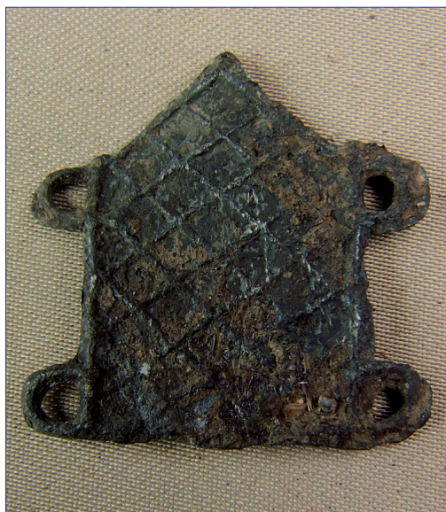
Fot. 4a, b. Znak pielgrzymi IP 1001, awers i rewers, wymiary 31 × 31,6 mm. Stan przed konserwacją