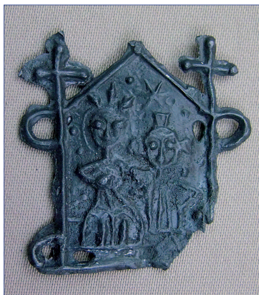
Fot. 12. Znak pielgrzymi IP 1342. Stan po konserwacji