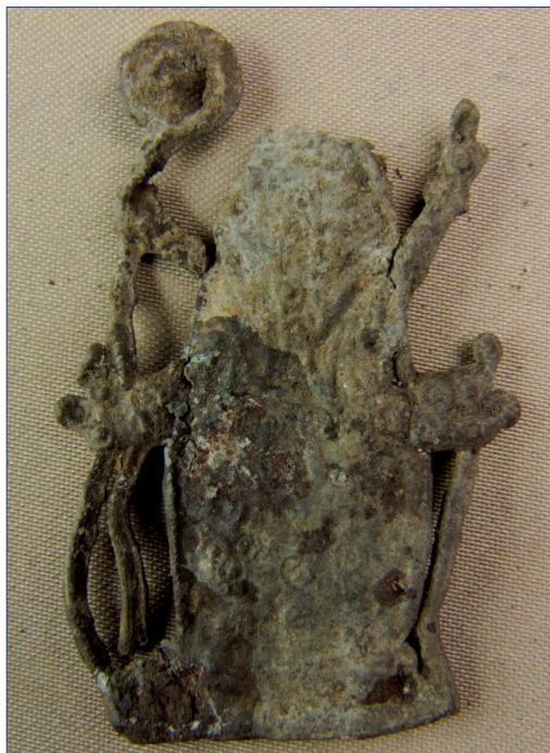
Fot. 1a, b. Znak pielgrzymi IP 129, awers i rewers, wymiary 54 × 34 mm. Stan przed konserwacją