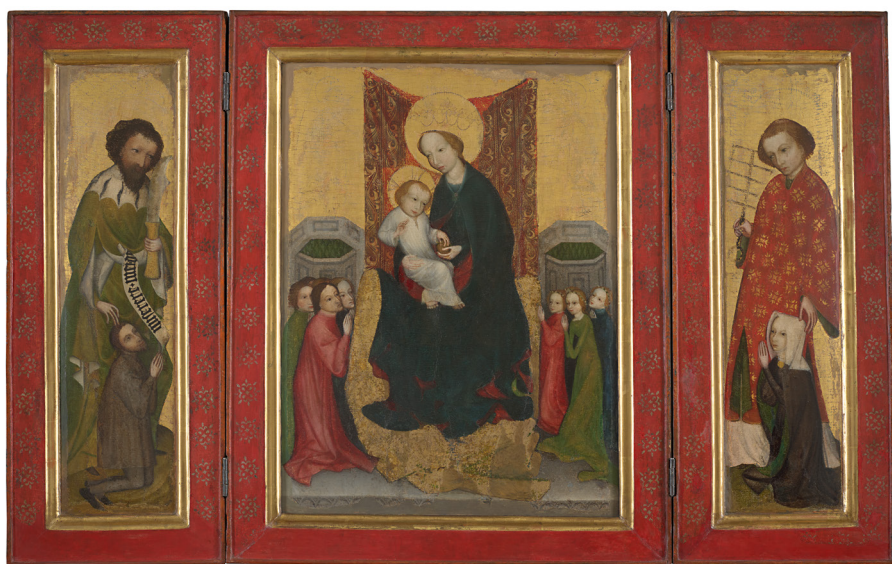
Il. 1. Kraków, Muzeum Narodowe, oddział Pałac Biskupa Erazma Ciołka. Tryptyk „z Domu Jana Matejki,” nr inw. MNK IX-4445, stan otwarty.