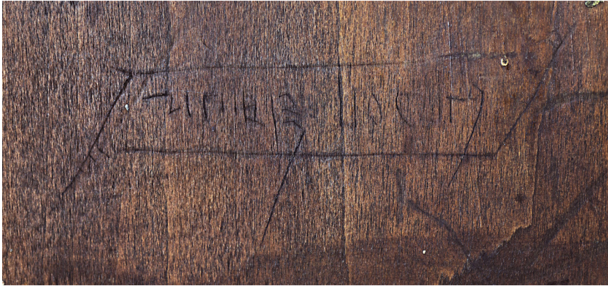
Il. 6. Kraków, Muzeum Narodowe, oddział Pałac Biskupa Erazma Ciołka. Tryptyk „z Domu Jana Matejki,” nr inw. MNK IX-4445, prawe skrzydło – rewers: wydrapana inskrypcja.