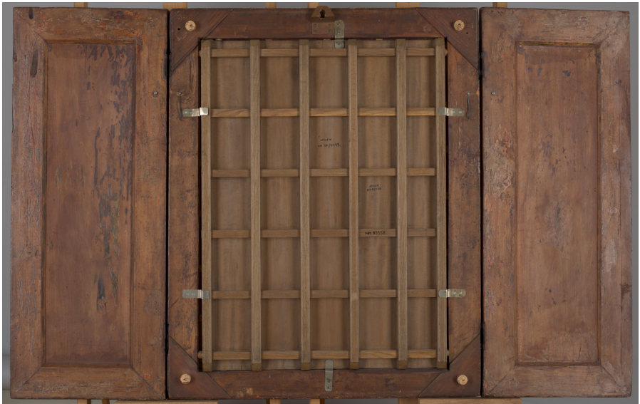
Il. 3. Kraków, Muzeum Narodowe, oddział Pałac Biskupa Erazma Ciołka. Tryptyk „z Domu Jana Matejki,” nr inw. MNK IX-4445, odwrocie nastawy.