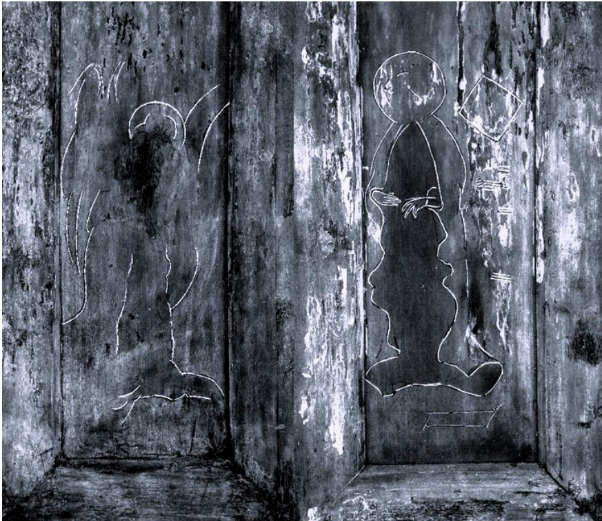
Il. 7. Kraków, Muzeum Narodowe, oddział Pałac Biskupa Erazma Ciołka. Tryptyk „z Domu Jana Matejki,” nr inw. MNK IX-4445, stan zamknięty, szkicowe uczytelnienie sceny Zwiastowania.