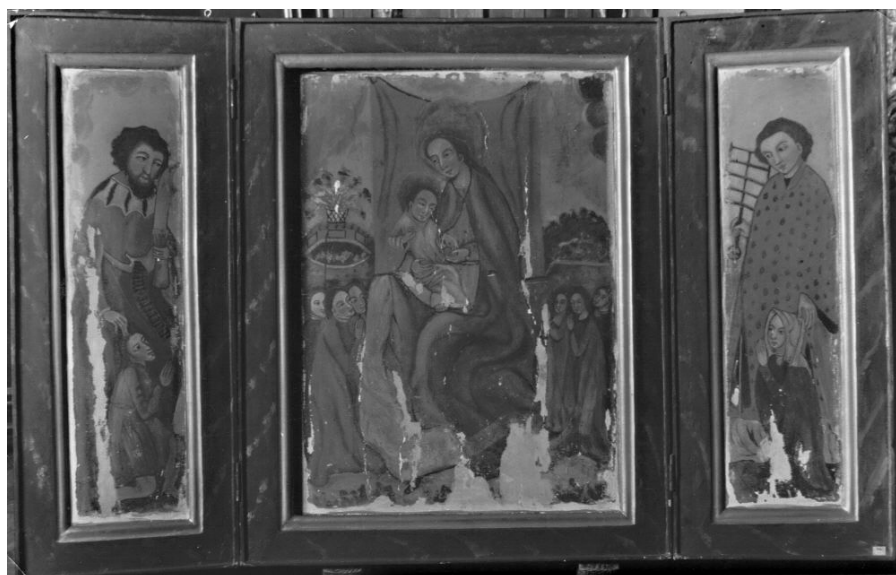
Il. 2. Kraków, Muzeum Narodowe, oddział Pałac Biskupa Erazma Ciołka. Tryptyk „z Domu Jana Matejki,” nr inw. MNK IX-4445.