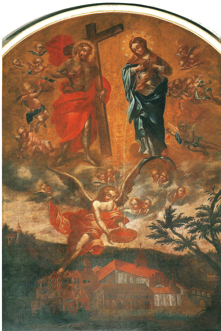
Il. 2. Gościkowo-Paradyż, kościół pocysterski, alegoryczne malowidło w ambicie.