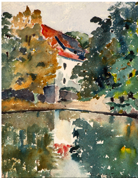
Il. 6. Kanał w Bydgoszczy (Nad kanałem) , Wanda Gentil-Tippenhauer, akwarela, 1925. Fot. ze zbiorów Muzeum Okręgowego im. Leona Wyczółkowskiego w Bydgoszczy, Dział Sztuki, nr inw. MOB MW-413. Fot. W. Woźniak