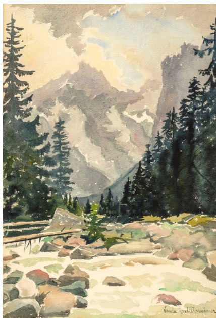
Il. 11. Dolina Białej Wody , Wanda Gentil-Tippenhauer, akwarela, 1925.