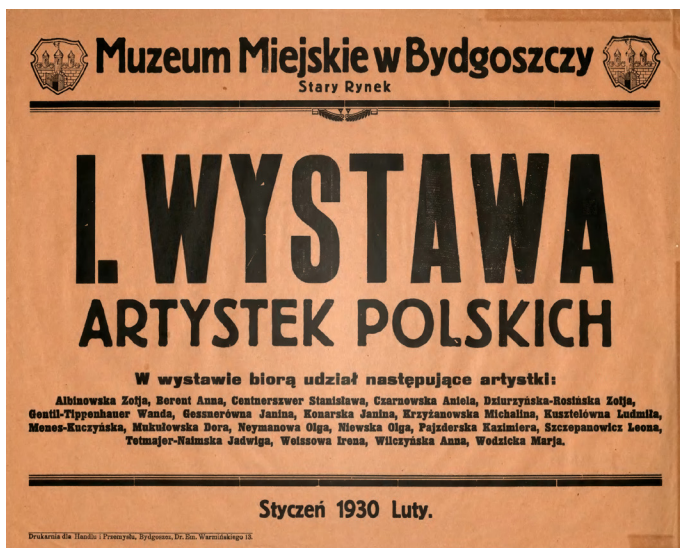
Il. 8. „I Wystawa artystek polskich”, Muzeum Miejskie w Bydgoszczy, afisz, 1930. Fot. ze zbiorów Wojewódzkiej i Miejskiej Biblioteki Publicznej im. dr. Witolda Bełzy w Bydgoszczy, Zbiory Specjalne, nr inw. DŻS XIV.3.2/4088