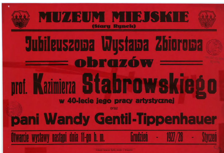
Il. 5. Afisz „Jubileuszowej Wystawy Zbiorowej obrazów prof. Kazimierza Stabrowskiego w 40-lecie jego pracy artystycznej i pani Wandy Gentil-Tippenhauer”, Muzeum Miejskie w Bydgoszczy, 1927. Fot. ze zbiorów Wojewódzkiej i Miejskiej Biblioteki Publicznej im. dr. Witolda Bełży w Bydgoszczy, Zbiory Specjalne, nr inw. DŻS XIV.3.2/4076