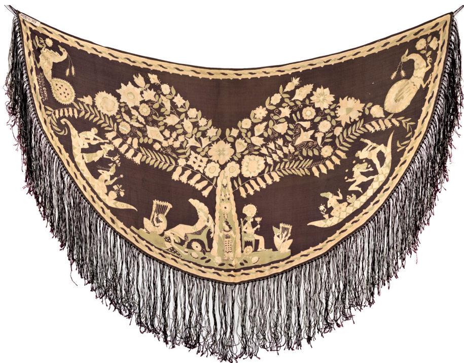
II. 7. Chusta, Wanda Gentil-Tippenhauer, jedwab, batik, lata 20. XX w. Fot. ze zbiorów Muzeum Okręgowego im. Leona Wyczółkowskiego w Bydgoszczy, Dział Historii, nr inw. MOB H-917. Fot. W. Woźniak