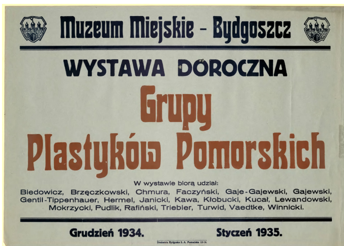
Il. 10. „Wystawa doroczna Grupy Plastyków Pomorskich”, afisz, 1934. Fot. ze zbiorów Wojewódzkiej i Miejskiej Biblioteki Publicznej im. dr. Witolda Bełzy w Bydgoszczy, Zbiory Specjalne, nr inw. DŻS XIV.3.2/4108