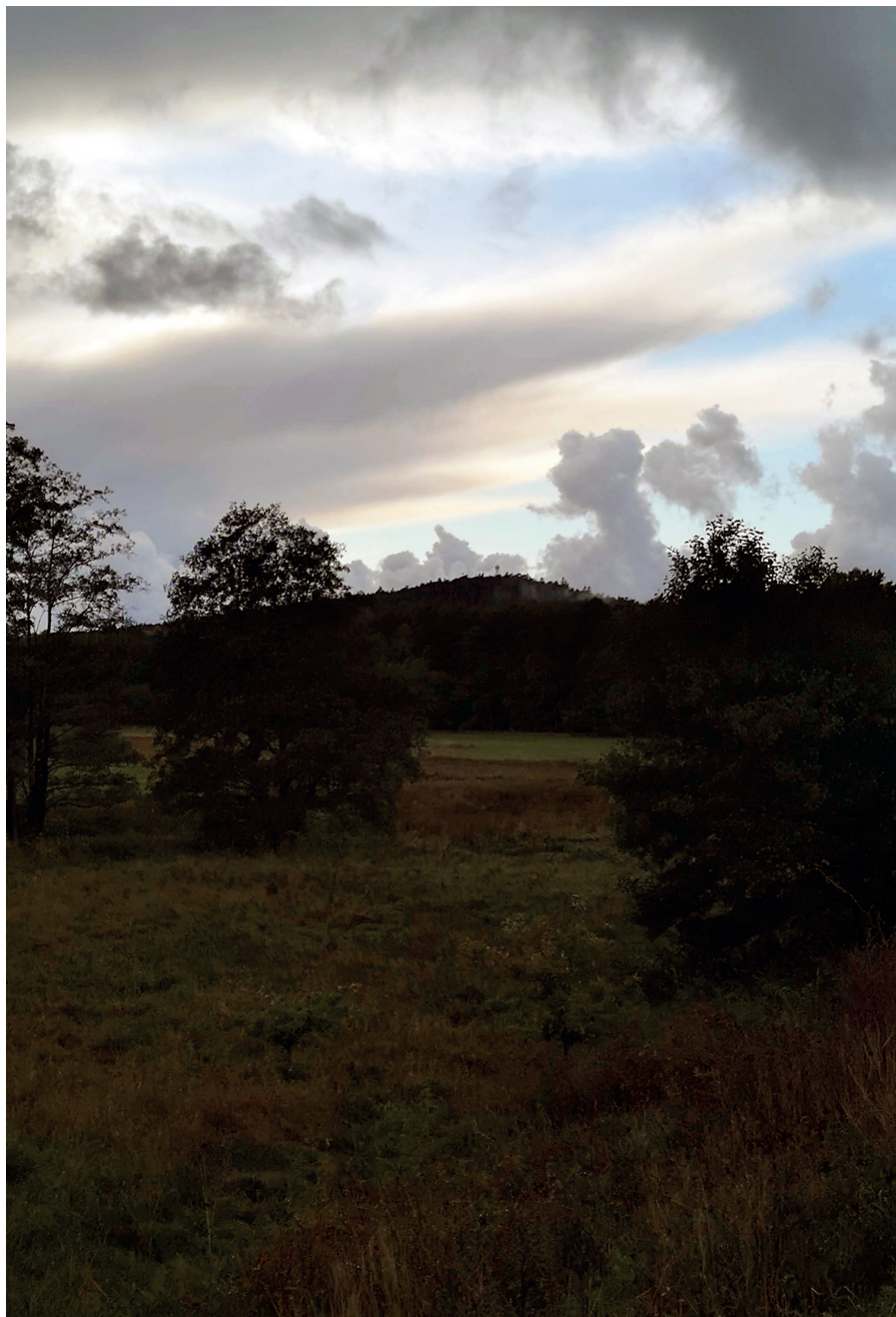
Ryc. 1. Widok na Rowokół od południowego wschodu