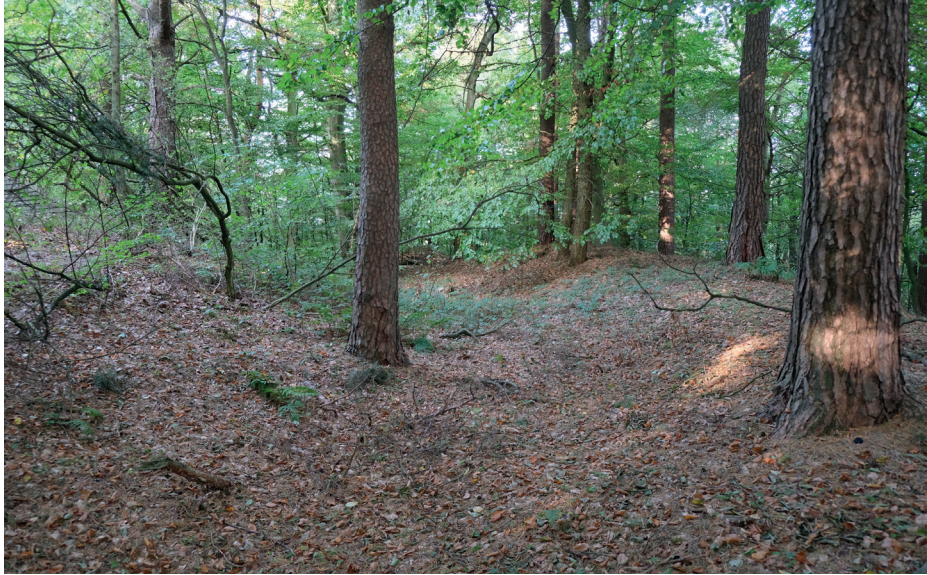
Ryc. 3. Widok na wał północny domniemanego grodziska – Smoldzino, stanowisko 4 – stan na październik 2021