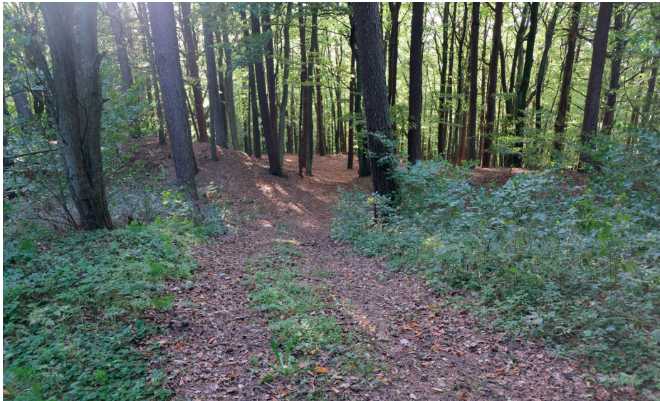
Ryc. 4. Widok na wał północno-zachodni fragment wału grodziska – Smoldzino, stanowisko 3 – stan na październik 2021