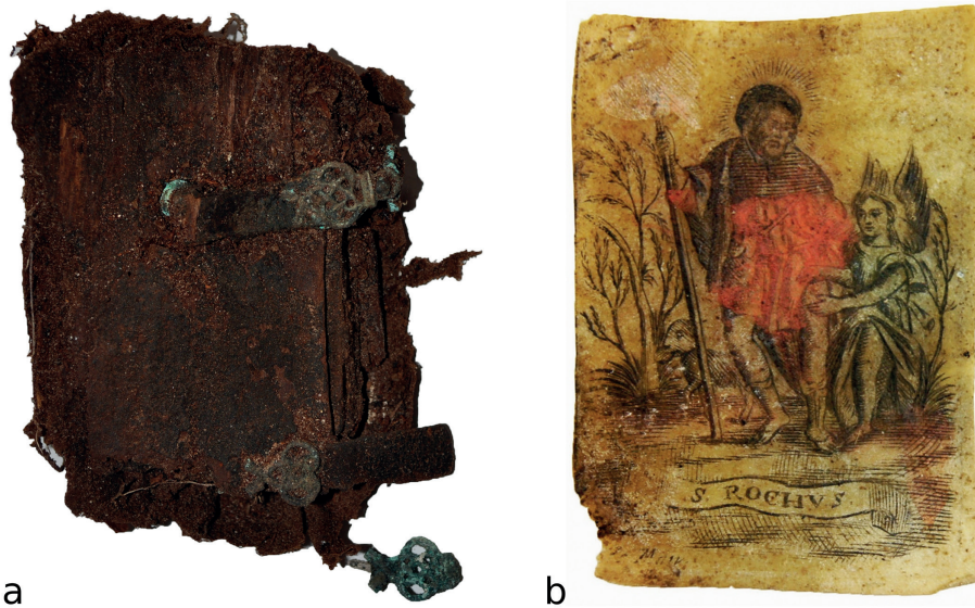
Ryc. 5. Zestawienie wybranych dewocjonałów: a – fragment modlitewnika, Gnień; b – obraz z wizerunkiem świętego, Szczuczyn (oprac. M. Majorek, M. Nowak)