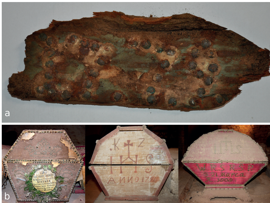
Ryc. 2. Zestawienie wybranych zdobień ułatwiających identyfikację zmarłego: a – Gniew, fragment krótkiego boku trumny z datą nabijaną nitami; b – Szczuczyn, krótkie boki trumien z szyldem, datą malowaną i nabijaną nitami (oprac. M. Majorek, M. Nowak)