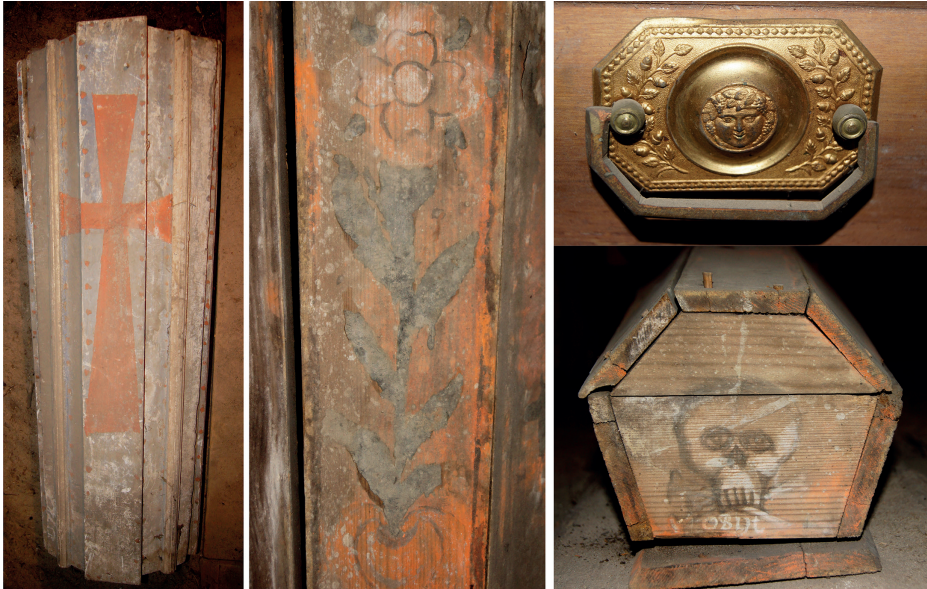
Ryc. 3. Zestawienie wybranych symboli na trumnach i dodatkach na przykładzie Szczuczyna (oprac. M. Majorek, M. Nowak)