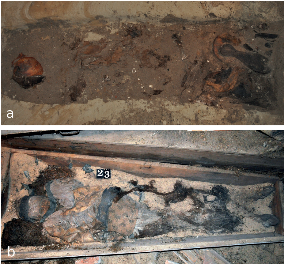
Ryc. 4. Pochówek kobiety w ubiorze grobowym: a – Gniew; b – Szczuczyn (oprac. M. Majorek, M. Nowak)