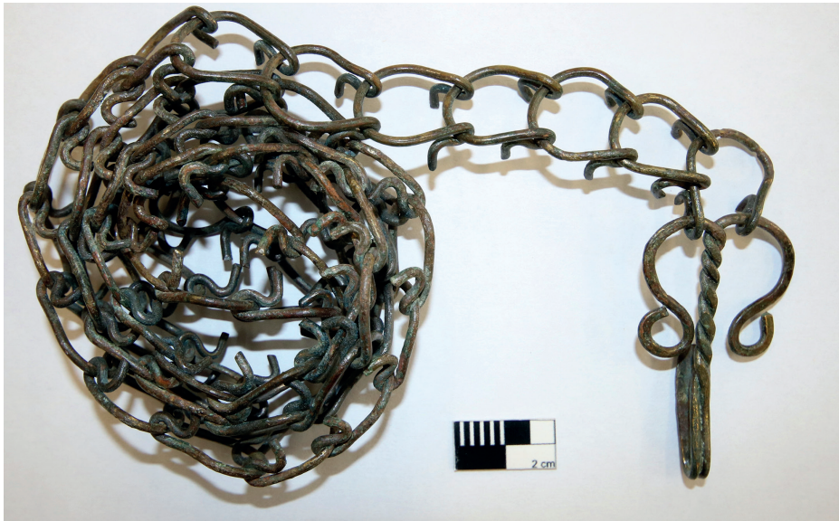
Ryc. 6. Gniew, powiat tczewski. Pas pokutny odnaleziony w 2012 roku w części prezbiterialnej kościoła, przy pochówku kobiety (oprac. M. Majorek)

Poza indywidualnymi środkami rozwoju duchowego, jak szkaplerze, różańce czy papierowe obrazki oraz niewątpliwie rzadko rejestrowane modlitewniki, zmarli otrzymywali także przedmioty, które służyły zachowaniu higieny osobistej czy umartwianiu za życia. Jeśli jest to grzebień odnaleziony na wysokości uda (tak jakby spoczywał w kieszeni spodni zmarłego), sytuacja ta nie dziwi. Natomiast w przypadku pasa pokutnego – cilice (takiego odkrycia dokonano w 2012 roku przy pochówku kobiety, którą złożono w grobie ziemnym w prezbiterium gniewskiego kościoła) – można być niemal pewnym, że mamy do czynienia z przedmiotem, który przez pewien okres towarzyszył zarówno ciału, jak i duchowi osoby, przy której go znaleziono (ryc. 6). Taka asceza wymagała samodyscypliny i powtarzania, może nawet kilka razy dziennie, bolesnych czynności związanych z nakładaniem, noszeniem i zdejmowaniem przedmiotu zadającego ból. Jednocześnie należy pamiętać, że nie była to kara nałożona przez osoby trzecie, ale chęć udręczania ciała z własnego wyboru.