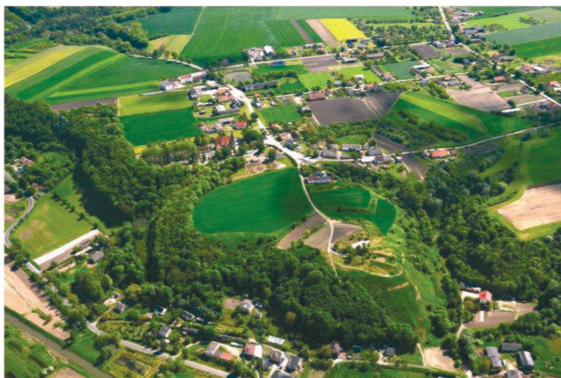
Ryc. 1. Starogród, pow. Chełmno. Widok na obszar dawnego założenia zamkowego (wg Chudziak 2014)