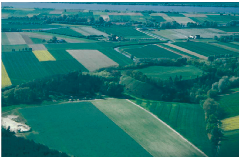
Ryc. 3. Kaldus, pow. Chełmno. Widok na Górę św. Wawrzyńca (wg Chudziak 2014)