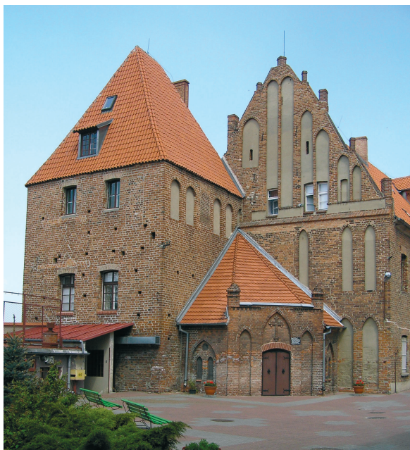
Ryc. 4. Chełmno. Wieża Mestwina i zachodni szczyt dawnego klasztoru cysterek