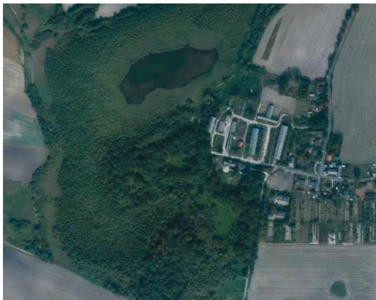
Ryc. 5. Lipienek, pow. Chełmno. Lokalizacja zamku w Lipienku (wg Google Map, oprac. D. Szczupak)