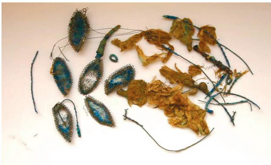
Ryc. 4. Gniew, wykop 5/2013, nawa. Elementy wianka – płatki kwiatów wykonane ze skręconego drutu lub z przędzy jedwabnej