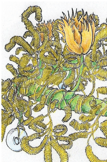
Ryc. 3. Gniew. Kaplica św. Anny, krypta południowa. Fragment rekonstrukcji wianka (rys. M. Nowak)