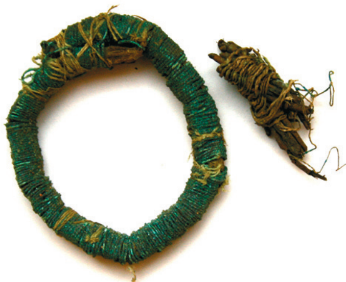
Ryc. 2. Toruń. Kościół pw. Wniebowzięcia Najświętszej Marii Panny. Elementy podstaw wianków