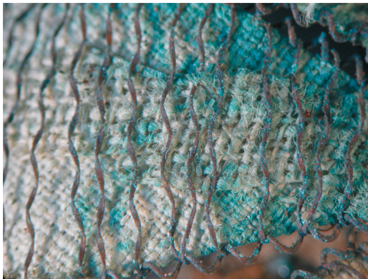
Ryc. 5. Gniew. Kaplica św. Katarzyny, krypta północna. Płatek z wianka, zbliżenie pod mikroskopem