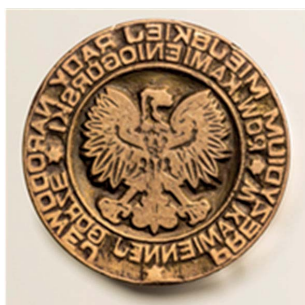
5. Prezydium Miejskiej Rady Narodowej w Kamiennej Górze, 1950. Tłok do tuszu, śr. 36 mm, sygn. S 5150