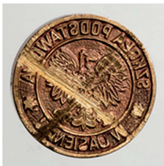
14. Szkoła Podstawowa w Jasieńcu, 1965–1966. Tłok do tuszu, śr. 20 mm, sygn. S 5084