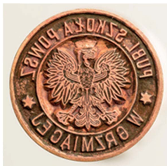
15. Publiczna Szkoła Powszechna w Grzmieżce, 1946. Tłok do tuszu, śr. 36 mm, sygn. S 5026