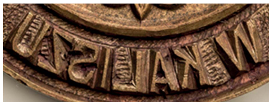
42. Napis wyryty ręcznie (po 1960), sygn. S 5135