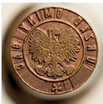
7. Urząd Gminy Gać, 1972–1973. Tłok do tuszu, śr. 20 mm, sygn. S 4833