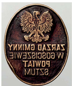
10. Zarząd Gminy w Gościszewie, 1948. Tłok do tuszu, śr. 35 x 28 mm, sygn. S 4609