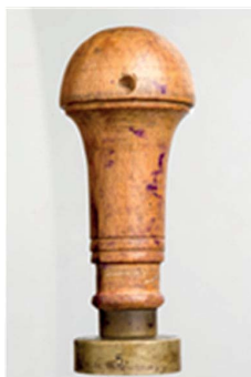
35. Uchwyt powojenny, sygn. S 4979