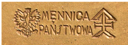
28. Sygnatura wybita na pieczęci przedwojennej, sygn. S 4699