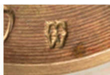
32. Format 2,2 mm