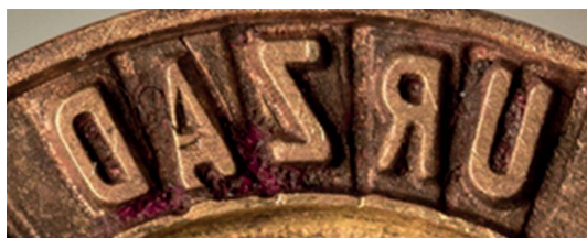
43. Napis wykonany grawerką redukcijną (1973), sygn. S 5186

Wszystkie obiekty pochodzą ze zbioru typariuszy władz powiatowych PRL, przechowywanego w Dziale Numizmatycznym Muzeum Książąt Lubomirskich, w Zakładzie Narodowym im. Ossolińskich