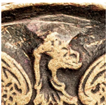
20. Sygn. S 4612