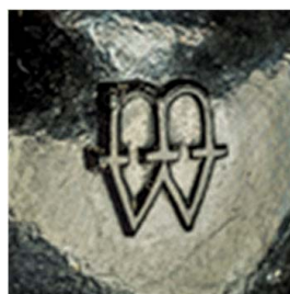
39. Sygnatura na uchwytach z lat 70.