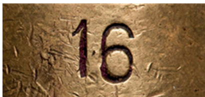
27. Numer kontrolny grawera, sygn. S 4609