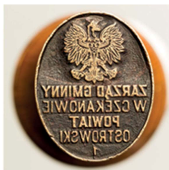
11. Zarząd Gminy w Czekanowie, 1929–1930 r. Tłok do tuszu, śr. 35 x 28 mm, sygn. S 4612