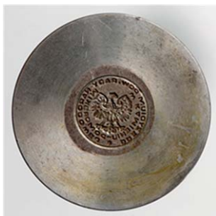
3. Prezydium Powiatowej Rady Narodowej w Kamieniu Pomorskim, przed 1972. Matryca do pieczęci suchej, śr. 20 mm, sygn. S 5166