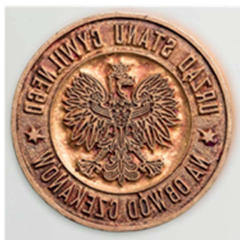
13. Urząd Stanu Cywilnego na Obwód Czekanów, po 1934. Tłok do tuszu, śr. 36 m, sygn. S 4699