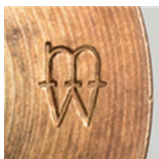
30. Format 5 mm