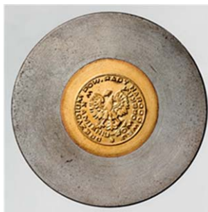
4. Prezydium Powiatowej Rady Narodowej w Kamieniu Pomorskim, przed 1972. Matryca do pieczęci suchej, śr. 20 mm, sygn. S 5167