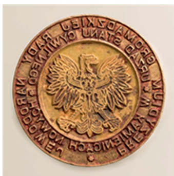
12. Urząd Stanu Cywilnego w Kamienicach Nowych, przed 1972. Tłok do tuszu, śr. 36 mm, sygn. S 5139