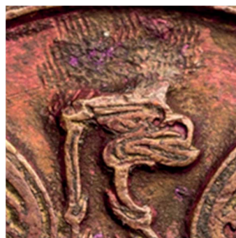
21. Sygn. S 4621