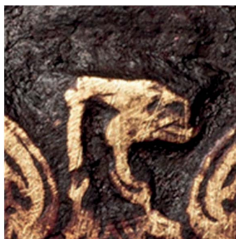
23. Sygn. S 4609