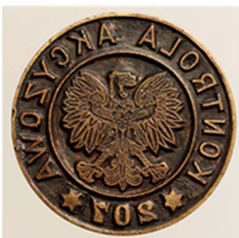
17. Kontrola Akcyzowa (rejon nr 207), 1946. Tłok do tuszu, śr. 36 mm, sygn. S 4621