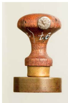
34. Uchwyt polniemiecki z matrycą powojenną, sygn. S 4621