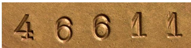
24. Numer ewidencyjny, sygn. S 4699