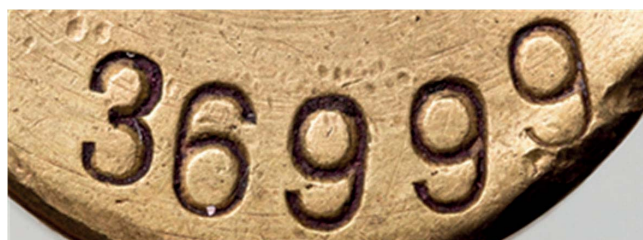
26. Numer ewidencyjny, sygn. S 4609