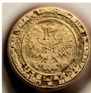
6. Prezydium Miejskiej Rady Narodowej w Kaliszu, 1962. Tłok do tuszu, śr. 20 mm, sygn. S 5122