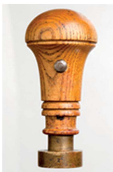
33. Uchwyt przed 1939, sygn. S 4699