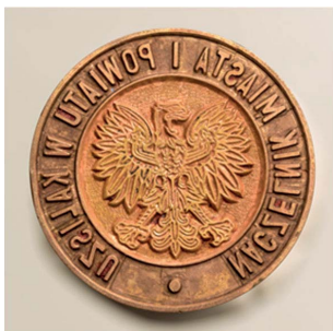
1. Naczelnik Miasta i Powiatu w Kaliszu, 1973 Tłok do tuszu, śr. 36 mm, sygn. S 5126