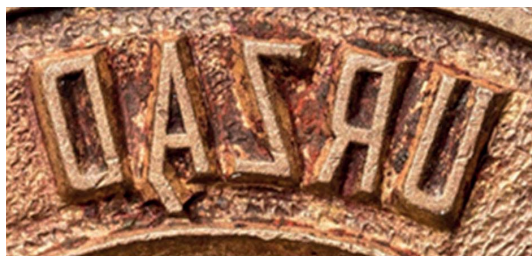
40. Napis wytłoczony „sztancówką” (po 1934), sygn. S 4699