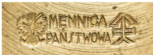
29. Sygnatura wybita na pieczęci powojennej (po 1945 r.), sygn. S. 4620