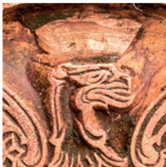
19. Sygn. S 5026