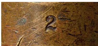
25. Numer kontrolny grawera, sygn. 4612