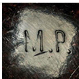
38. Oznaczenie na uchwytach z lat 60.