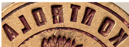
41. Napis wybity puncami (po 1944), sygn. S 4636