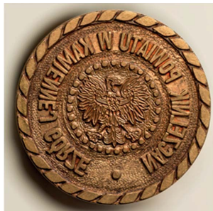
2. Naczelnik Powiatu w Kamiennej Górze, 1973–1974 Tłok do tuszu, śr. 25 mm, sygn. S 5152