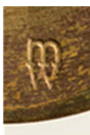
31. Format 3 mm