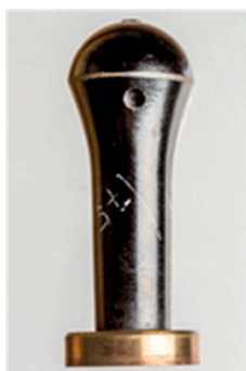
37. Uchwyt z lat 70., sygn. S 5162