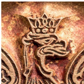
18. Sygn. S 4699