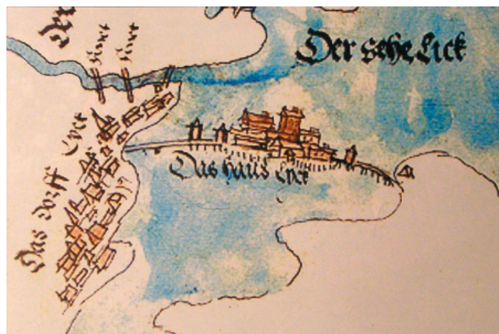
Ryc. 1. Elk. Widok miasta i zamku na mapie z 1541 roku (wg Herman 2015)