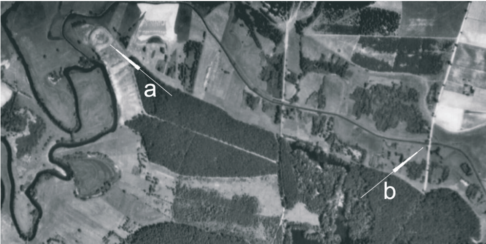
Ryc. 2. Lokalizacja zespołu osadniczego w Grażawach (a) i domniemana przeprawa mostowa (b)