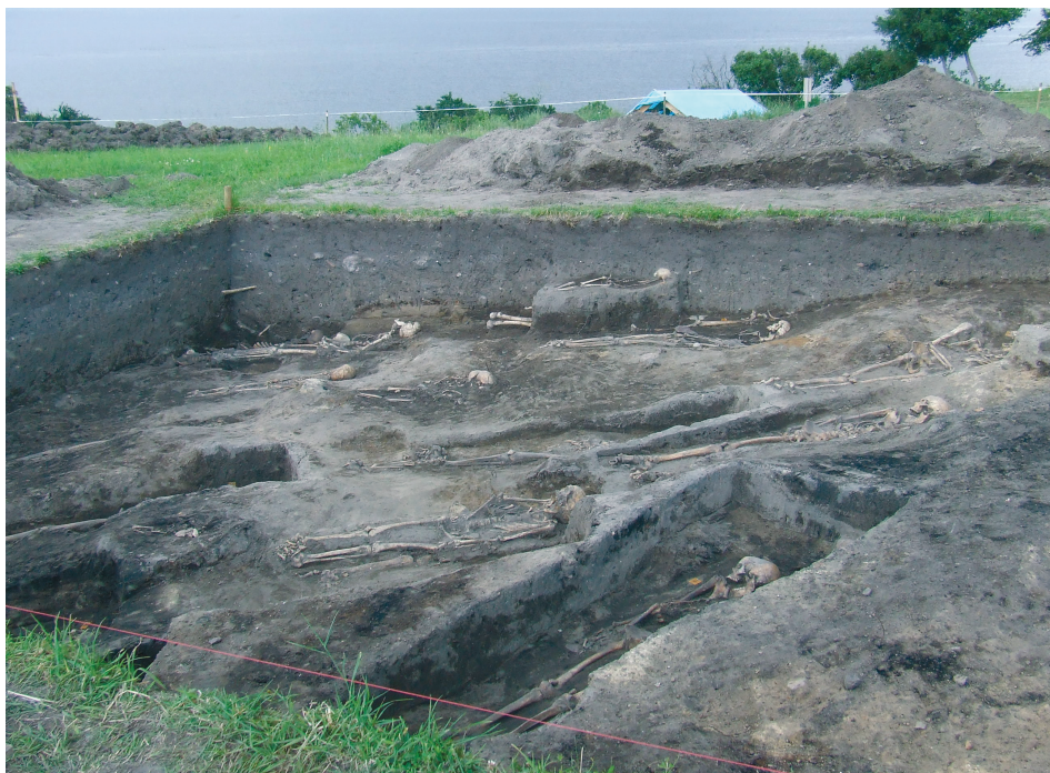
Ryc. 4. Lubin, wyspa Wolin. Fragment cmentarzyska odkrytego na grodzisku – widok od północy