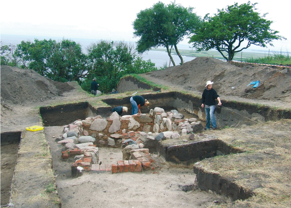
Ryc. 5. Lubin, wyspa Wolin. Fundamenty wieży mieszkalnej w trakcie badań