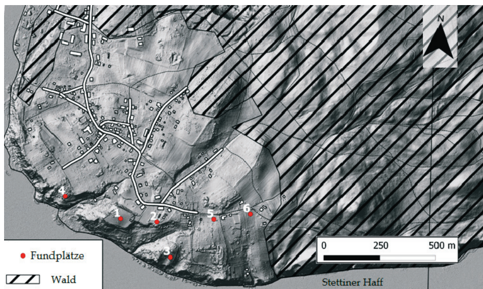
Ryc. 1. Lubin, wyspa Wolin. Rozmieszczenie stanowisk archeologicznych datowanych na wczesne średniowiecze: 1 – grodzisko, 2–5 – osady, 6 – cmentarzysko (oprac. G. Kierszys)