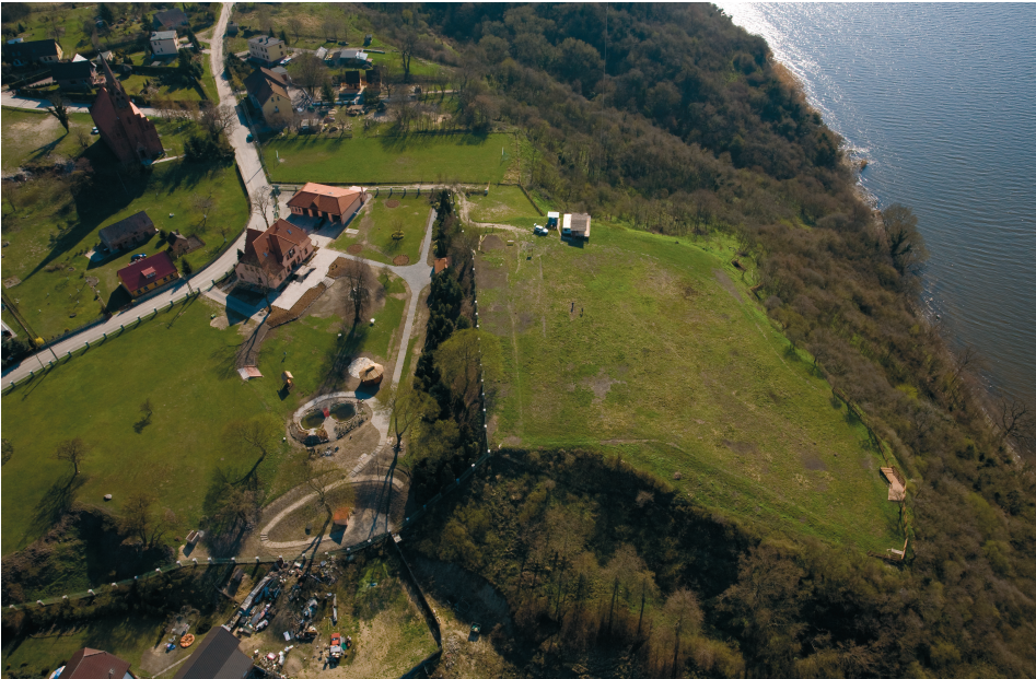
Ryc. 2. Lubin, wyspa Wolin. Grodzisko z lotu ptaka – widok od północnego zachodu