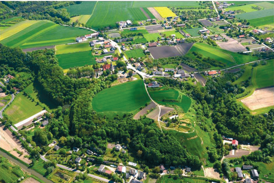
Ryc. 4. Widok na grodzisko i zamczysko w Starogrodzie Fig. 4. View of the stronghold and the castle in Starogród