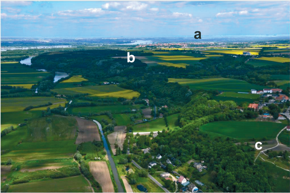
Ryc. 2. Widok na okolice Chełmna (a), Kaldusa (b) i Starogrodu (c) Fig. 2. View of the Chełmno (a), Kaldus (b) and Starogród area (c)