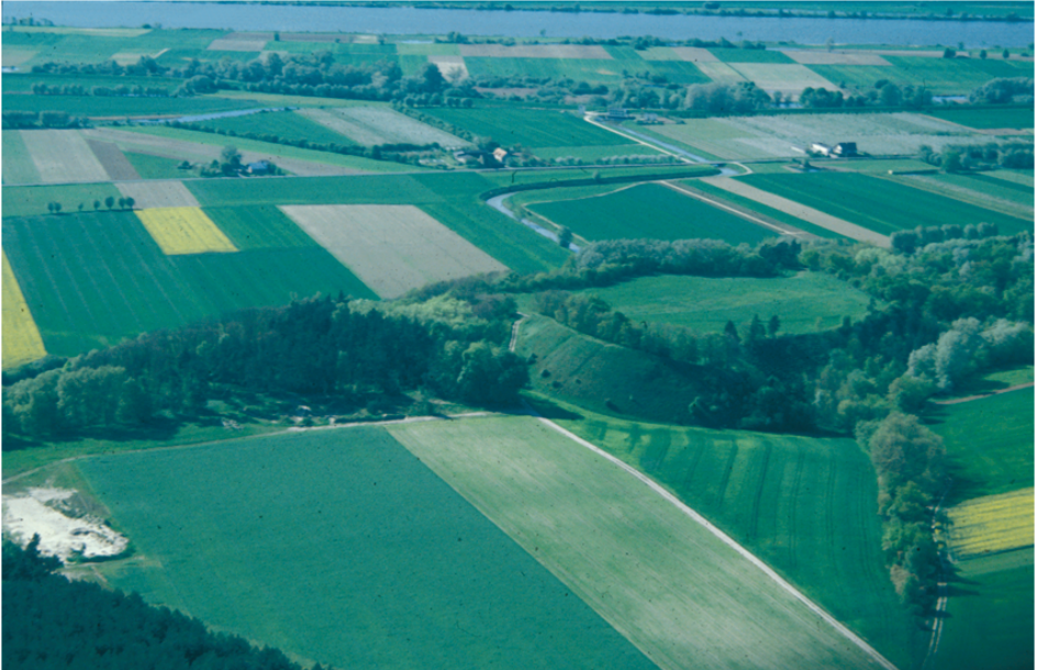
Ryc. 3. Widok na Górę św. Wawrzyńca w Kaldusie Fig. 3. View of Mount St. Laurence in Kaldus